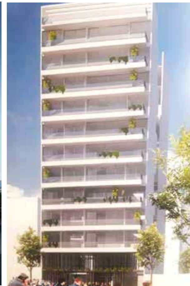
Fideicomiso La Plata