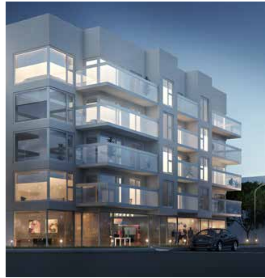
Edificio Marinas Tower, Ushuaia

Se han desarrollado eventos sociales tales como: Presentaciones de Obras de Teatro, Talleres de Manualidades, Pinturas y Artesanías de libre acceso para los asociados. Eventos conmemorativos al "Día de la Independencia", día del Amigo, con gran asistencia de asociados, familiares y amigos. Estos eventos fueron solventados con aportes personales de los asistentes.