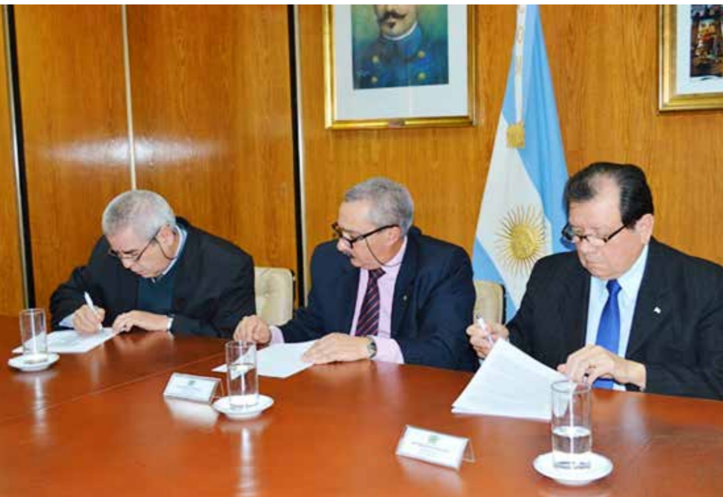
Directivos durante la Asamblea

La Comisión Directiva, en cumplimiento de lo establecido en los artículos 23º, Incisos a), b), c), e), f), k); artículo 36; artículo 37º; incisos a), b) y c); artículo 39º; artículo 40º, incisos c), g), n), artículos 41º, 42º y 46º del Estatuto Social, convoca a los Señores Representantes Titulares a la Asamblea Ordinaria a realizarse el día 27 de Noviembre de 2019, a las 09:00 horas, en la Sede Central del Círculo Oficiales de Mar, sita en Sarmiento 1867, de la Ciudad Autónoma de Buenos Aires, para tratar el siguiente: